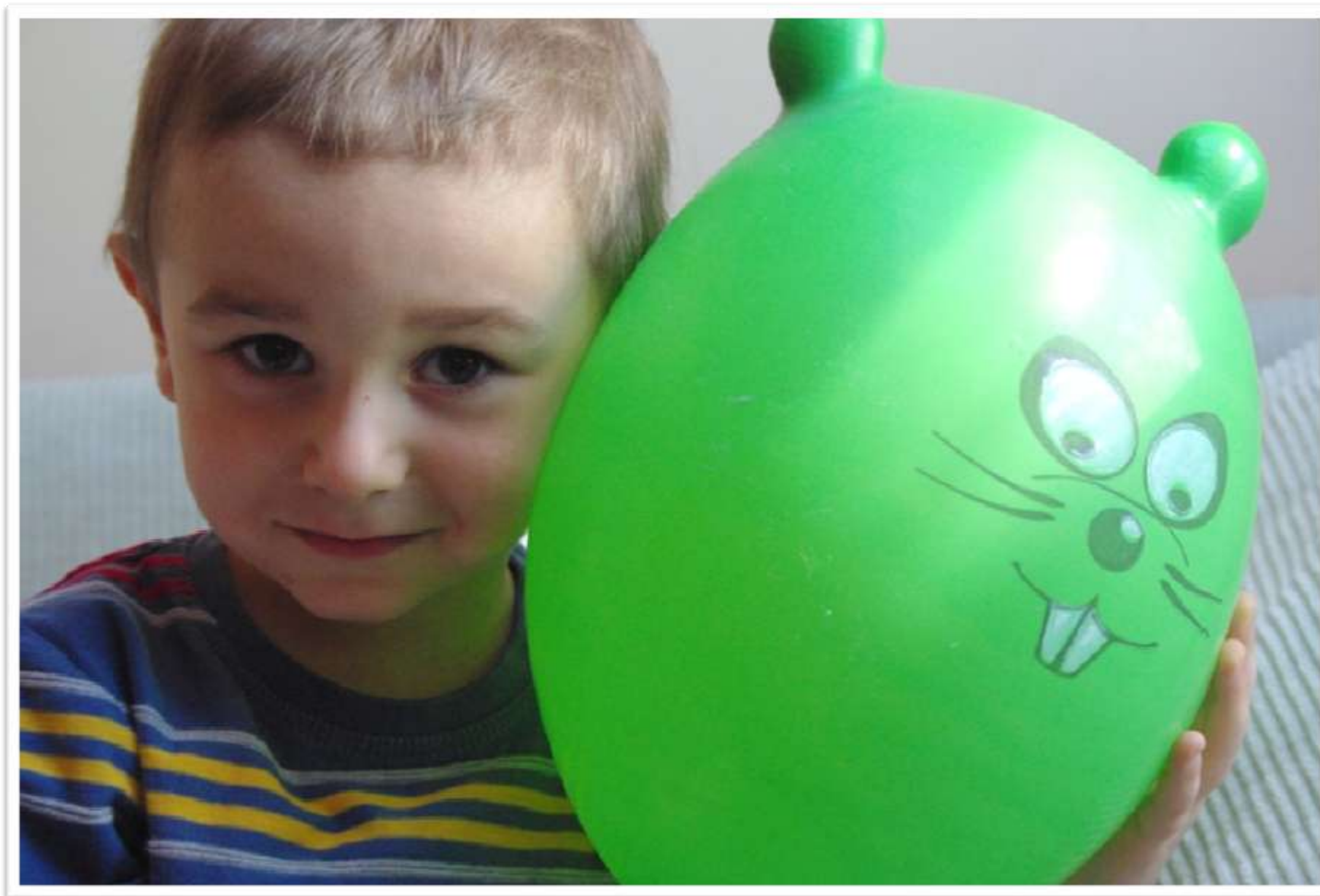
6. A imię tej Podróży – Życie.