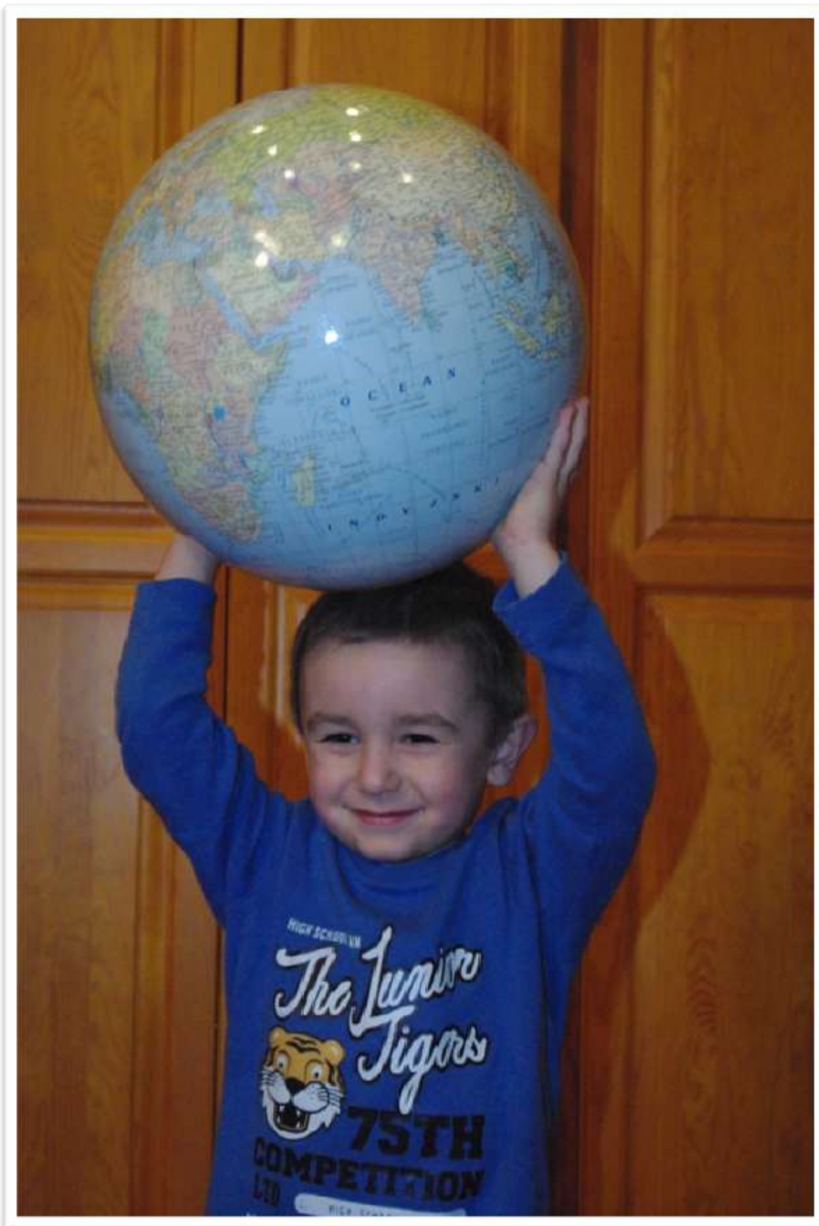
5. Jeśli chcesz zmieniać świat, zacznij od siebie