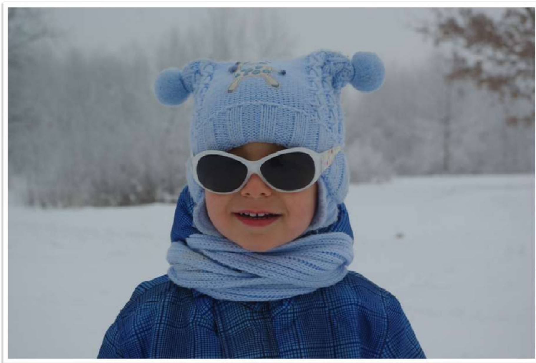
4. Nie ma dzieci – są ludzie ...