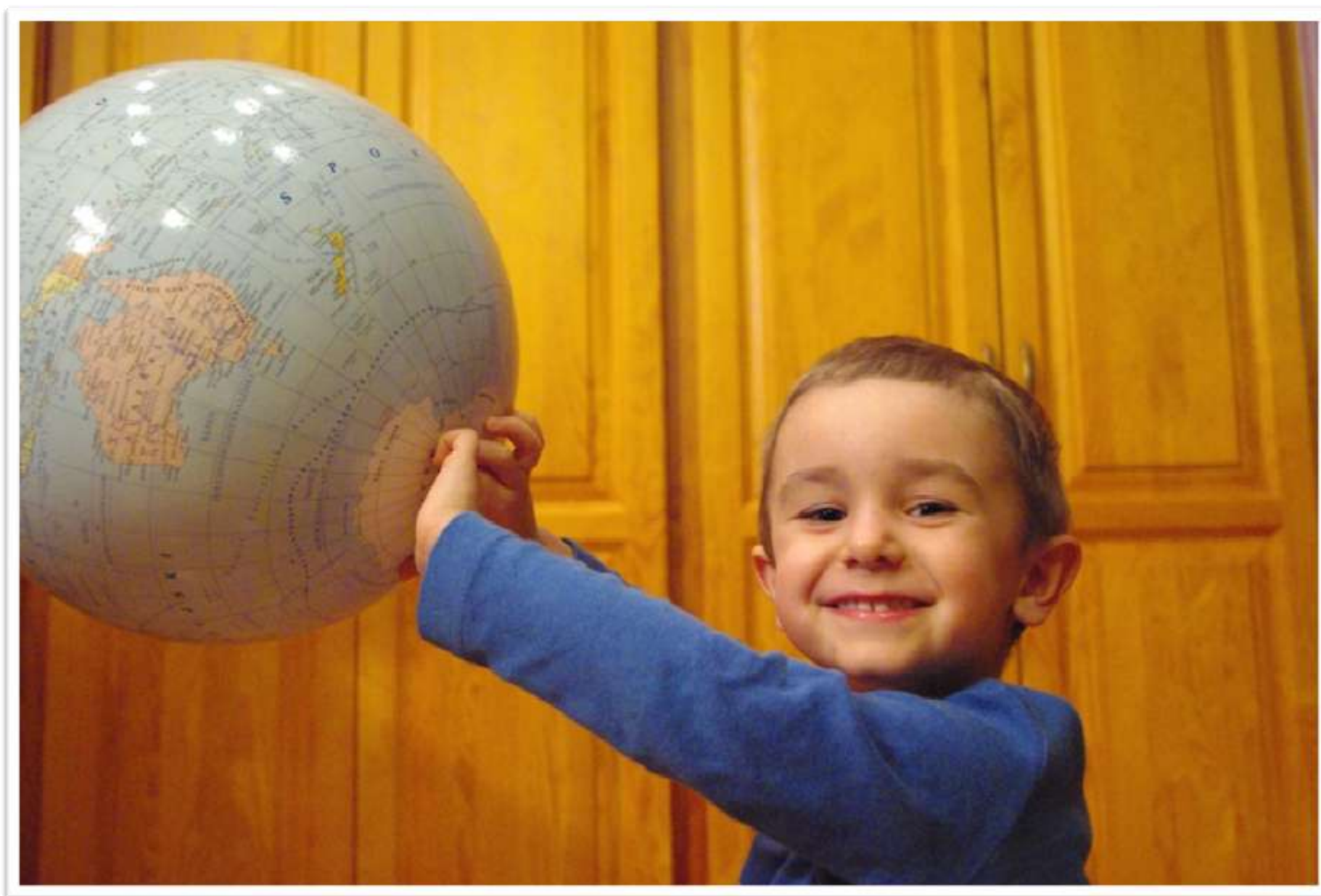
7. Nie wolno zostawiać świata takim, jakim jest.